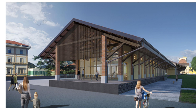
VISTA DI SUD EST LATO PARCHEGGIO