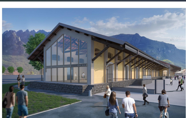
VISTA DI NORD OVEST LATO VIA AMENDOLA